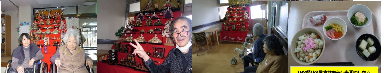
ひな祭りの昼食はちらし寿司でした☆