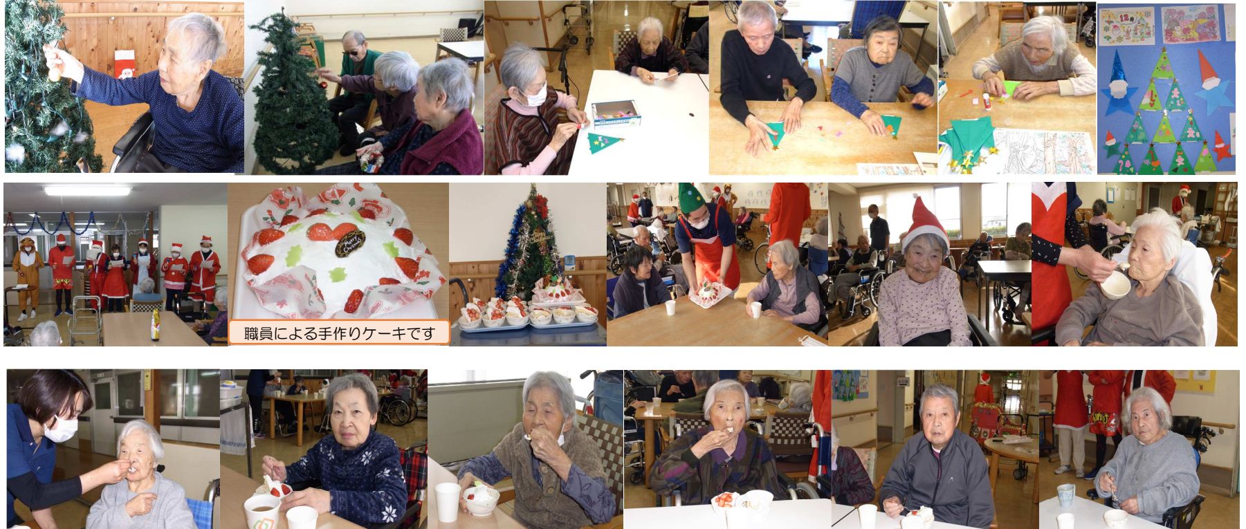
職員による手作りケーキです