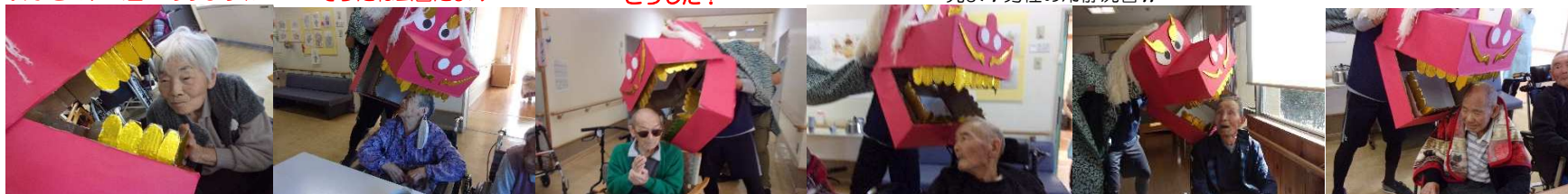
見よ!男性の冷静沈着!!