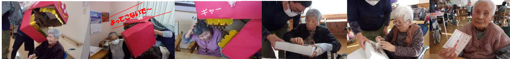
獅子さん、虫歯がありますね