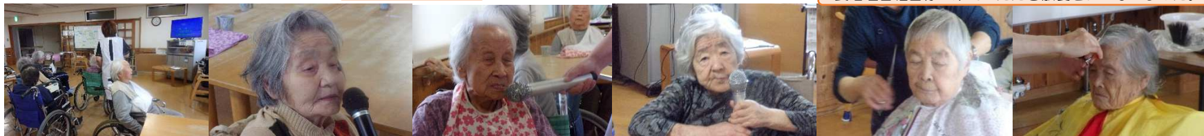
妻沼理容組合様に来ていただき散髪をおこないました。