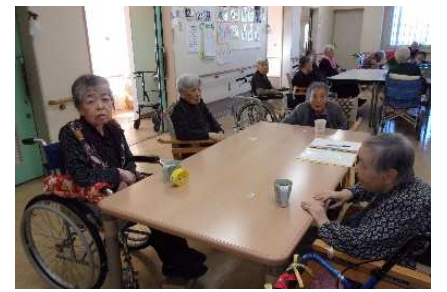
ワイドショーにむちゅう