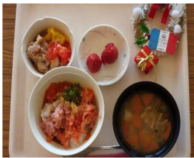
誕生会の昼食です